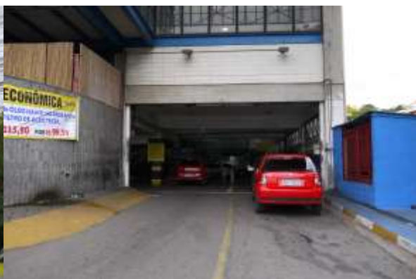
店舗に隣接するピット入口