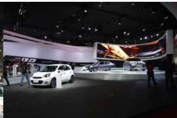
日産は2つのブースに分かれての展示