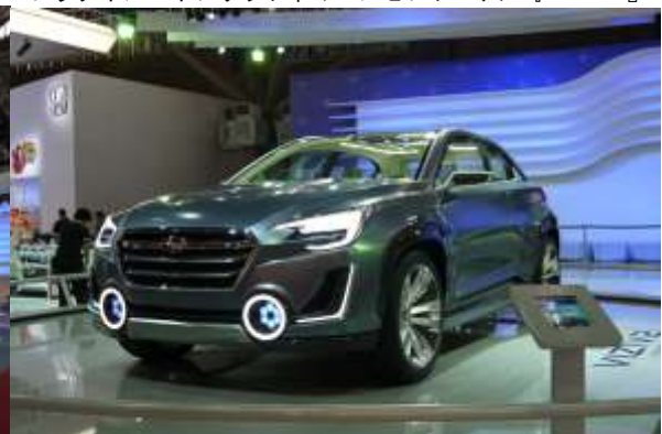
今年のジュネーブ・モーターショーで初公開された次世代 クロスオーバーハイブリッド車『VIZIV 2 コンセプト』