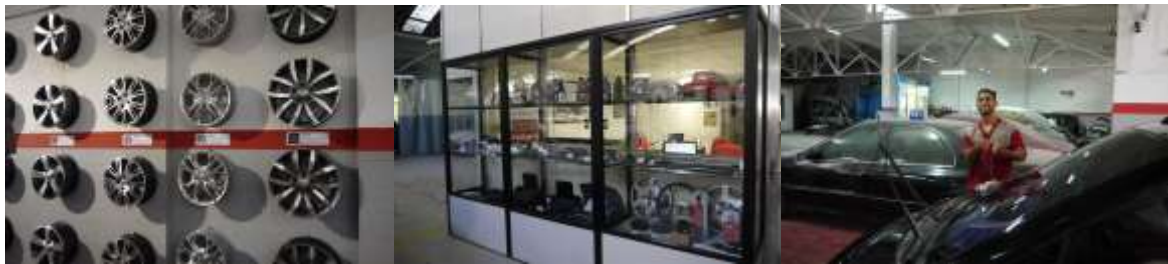
アフターのアルミ、純正補修パーツやアクセサリ類をディスプレイする