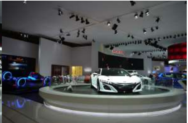
発売が待たれる NSX のコンセプトカーも展示されていた