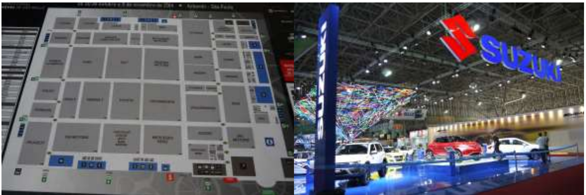
会場配置図からもコンパクトなショーであることがわかる