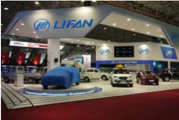
中国や韓国といったメーカーの出展もあった