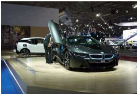
BMW ブースはMシリーズやi3、8といったスペシャルモデルの展示に力を入れていた