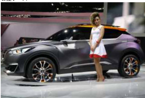
ブラジル向けに製作された『キックス・コンセプト』