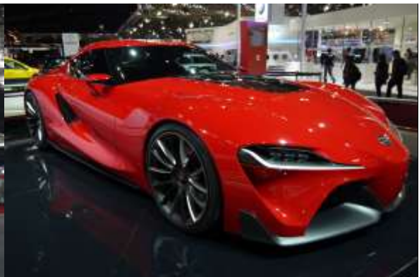
デトロイトショーで発表されたコンセプトカー『FT-1』