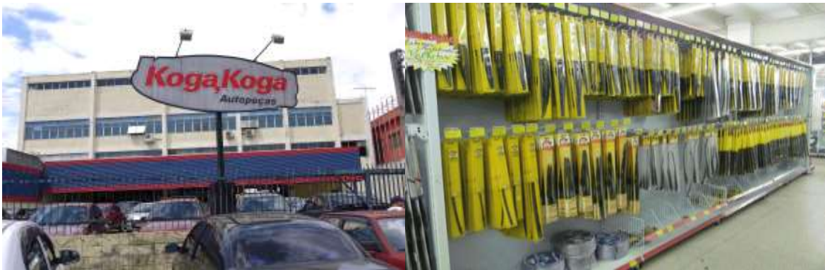
Kogakoga サンパウロ店全景