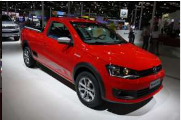
今回初公開、南米市場専用のサベイロをベースとしたスポーティグレード『サベイロ・サーフ』