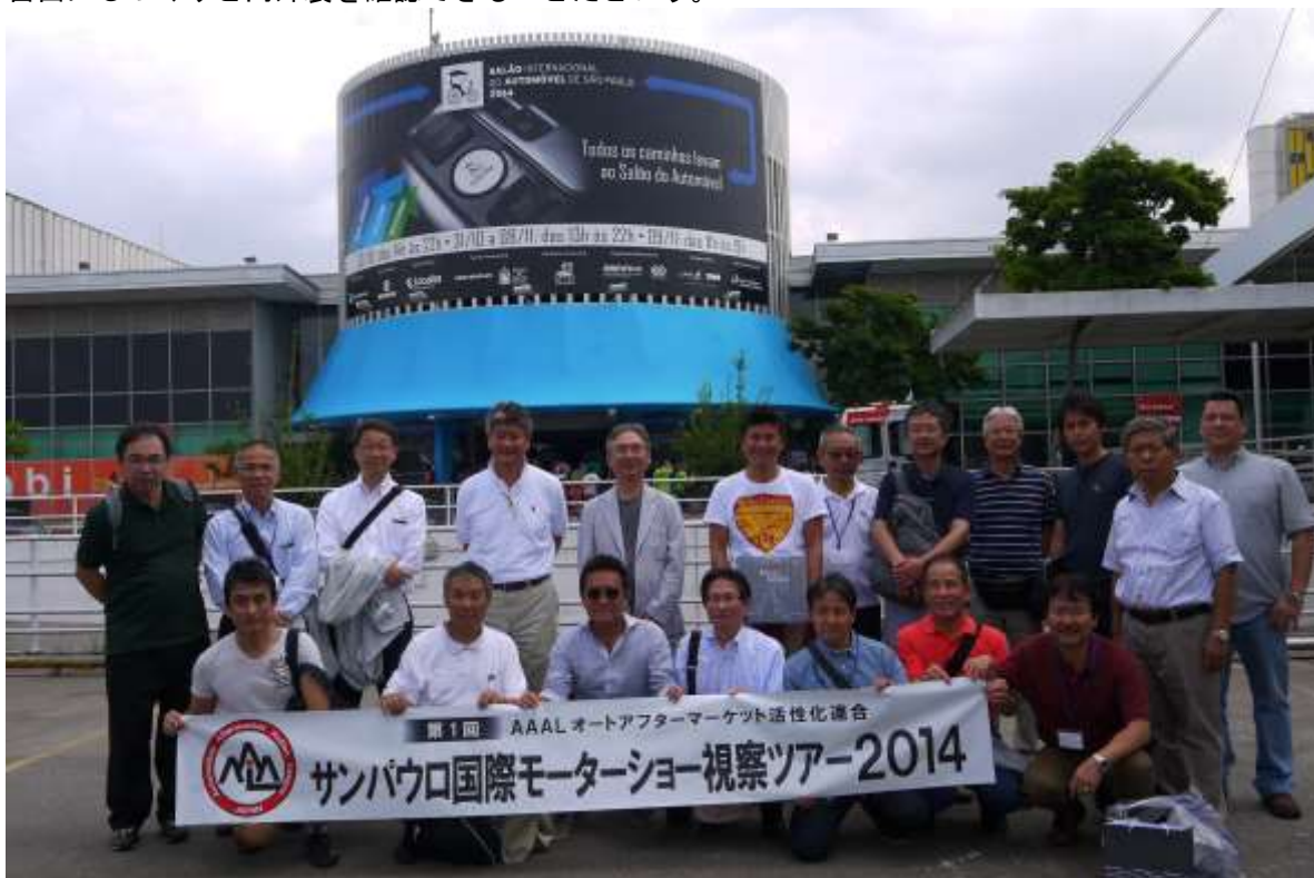
サンパウロ国際モーターショー14 会場前にて

現地の方に聞いたところ、日本に比べ高い入場料の対価は自分のお目当ての車が一堂に揃っていて自由にじっくりと内外装を確認できることだという。