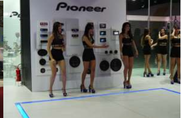
唯一オーディオメーカーの出展社 パイオニア