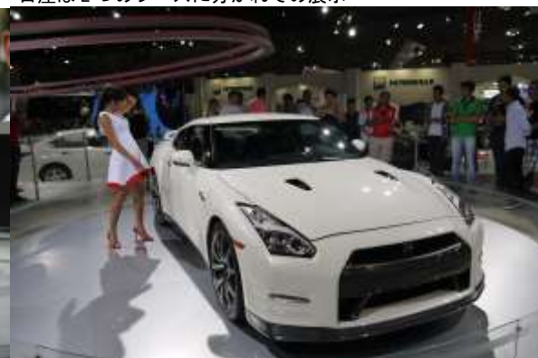
『GT-R (R35)』の展示 触れない展示車両は人気が無い？