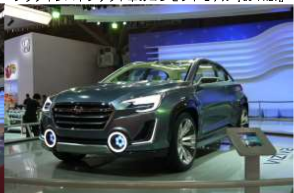
今年のジュネーブ・モーターショーで初公開された次世代 クロスオーバーハイブリッド車『VIZIV 2 コンセプト』