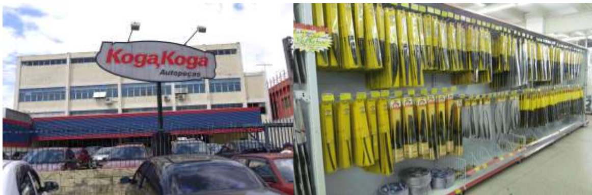
Kogakoga サンパウロ店全景