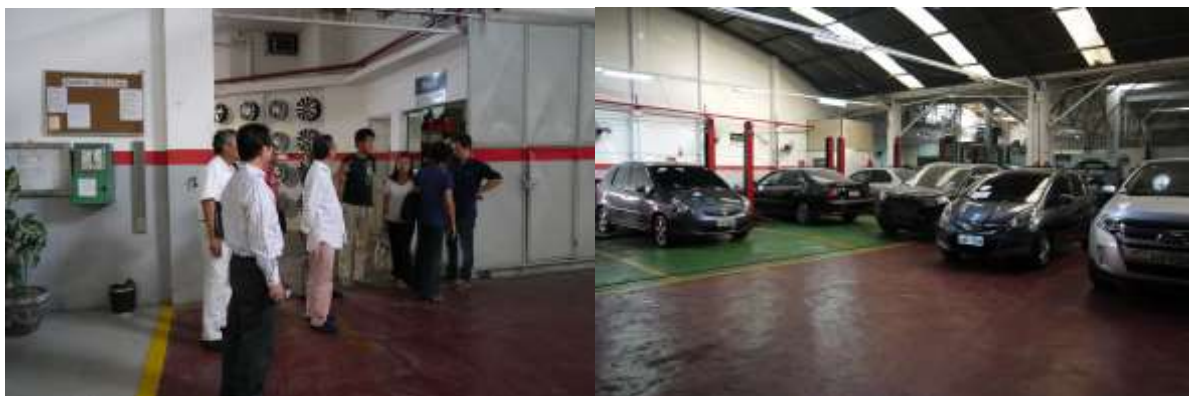
説明を受ける参加者達