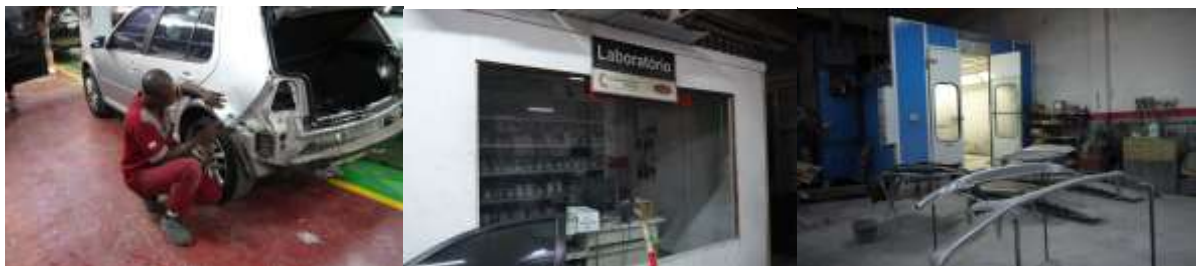
板金、調色、塗装といった一連の作業をここではこなす