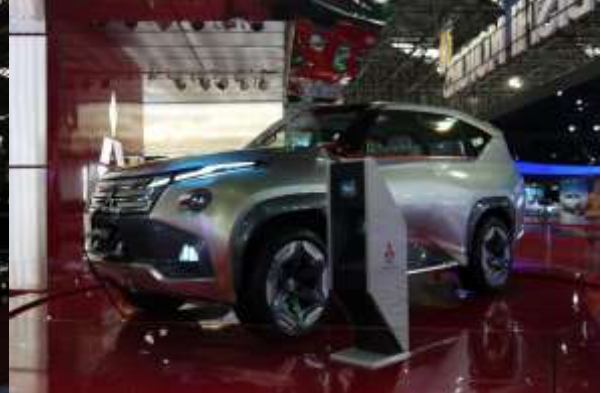
前回 2013 年の東京モーターショーでも展示されていた プラグインハイブリッド車のコンセプトモデル『GC PHEV』