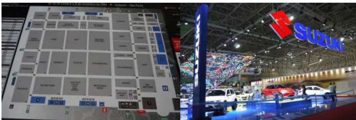
会場配置図からもコンパクトなショーであることがわかる