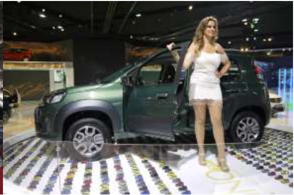
ブラジル国内でシェアトップのフィアットは、小型車の展示に工夫を凝らしている