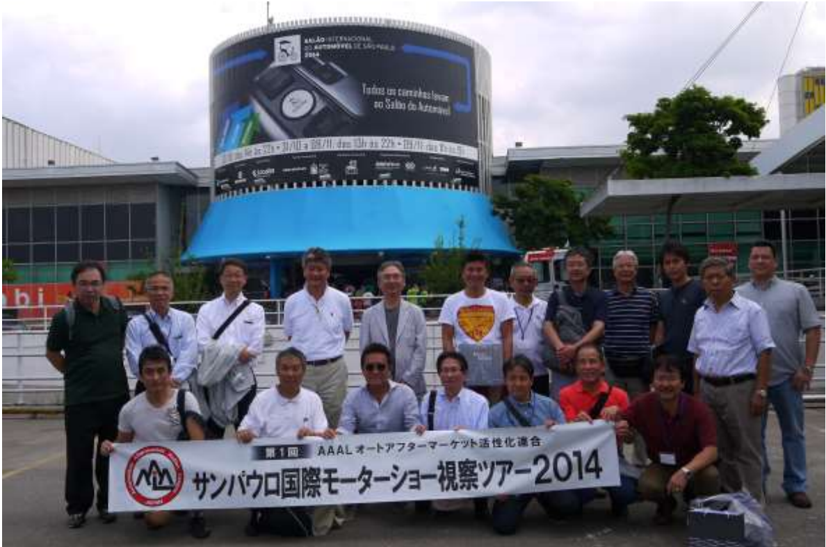
サンパウロ国際モーターショー14 会場前にて

現地の方に聞いたところ、日本に比べ高い入場料の対価は自分のお目当ての車が一堂に揃っていて自由にじっくりと内外装を確認できることだという。