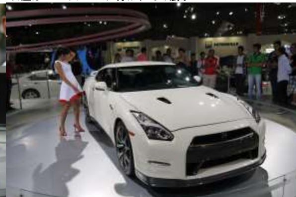
『GT-R (R35)』の展示 触れない展示車両は人気が無い？