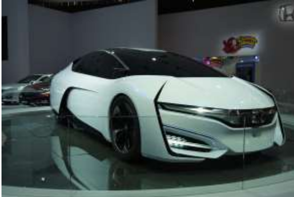
ホンダの燃料電池自動車『FCEV コンセプト』