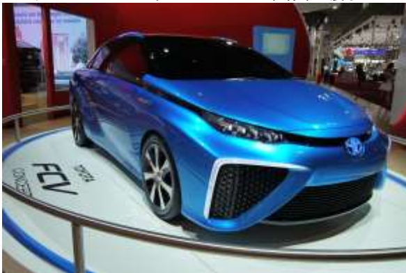
先日国内で発売されたばかりの燃料電池自動車『FCV』の コンセプトモデル プリウスの展示もあった