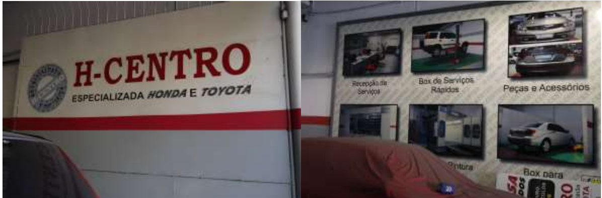
視察に伺った H-CENTRO 社

リオデジャネイロ最終日にトヨタ及びホンダ、両社の公認を受けているという修理工場の視察を行った。修理は多岐に渡り、オイル交換といった一般的なメンテナンスから整備、また板金作業まで行う。空調設備は無くパテ研ぎの粉が舞う工場内は、日本と比べると決して労働環境は良いとはいえないが、ブラジル国内の他のところと比べればまだ恵まれているとのこと。