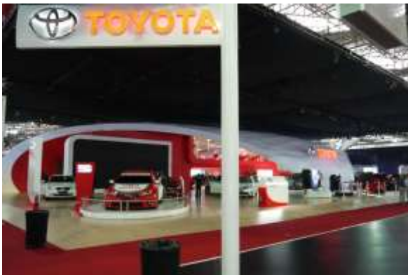
トヨタブース カラーベースのレース仕様車の展示