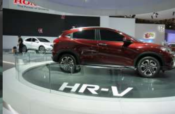
ブラジルで来年発売予定の新型『HR-V（日本名：ヴェゼル）』