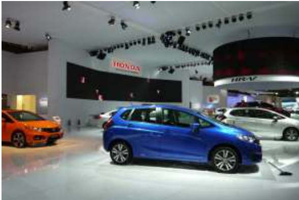
ホンダブース 小型車が中心の展示コーナー