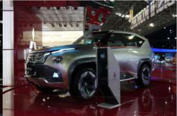
前回 2013 年の東京モーターショーでも展示されていた プラグインハイブリッド車のコンセプトモデル『GC PHEV』