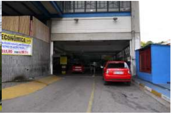
店舗に隣接するピット入口