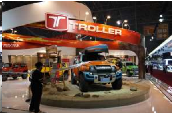
日本では馴染のないブラジルの老舗メーカー『トロラー社』現在はフォードの傘下にある