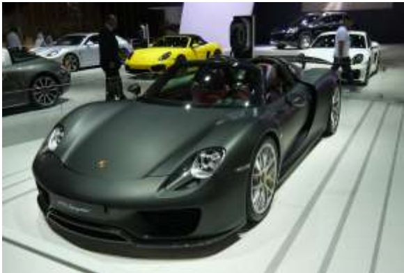
ポルシェやフェラーリ、マセラティといった高級車を購入する富裕層も存在し、渋滞を理由に週末のみ使用するとのこと