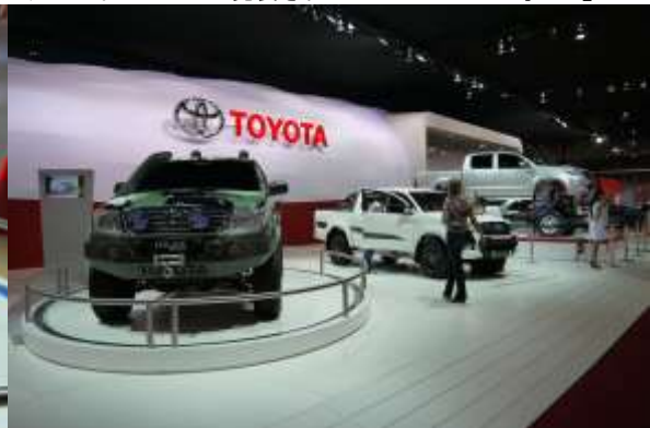
ブラジルでは各メーカーが SUV、RV、ピックアップトラック といったジャンルに積極的に力を入れている