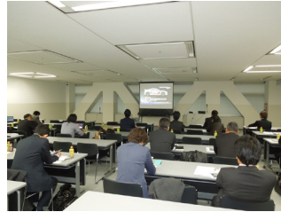
動画版の試写風景