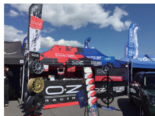
オーゼットジャパン