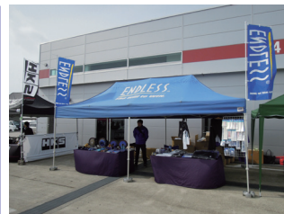
エンドレスアドバンス