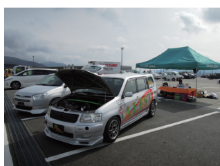
シンボリウォーカージャパン