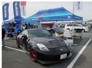
エイチ・ピー・アイ