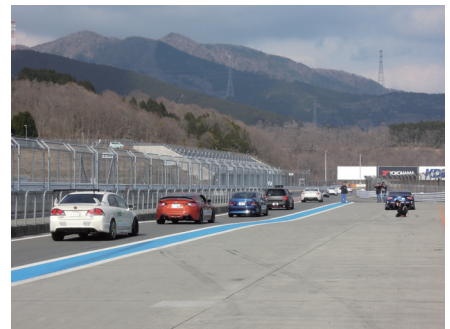
当日はドライコンディションでの走行が可能に