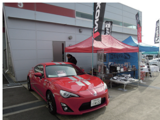
アサヒライズ FET 事業部

また併催イベント「エンドレス・サーキットミーティング」から4社（1社はコーヒーショップ）が出展しました。