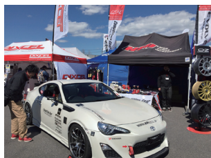
エイチ・ピー・アイ

当振興会事務局はNAPAC FESTAと日程が重なり出展出来ませんでした。モビリティランド様に頂いたエアーサインポップを設置し、会のPRに務めました。