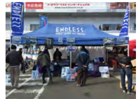
エンドレスアドバンス