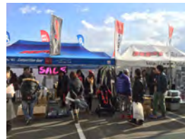
エイチ・ビー・アイ

カーも含め最新のカスタマイズパーツを出品し、パーツについては展示即売を行いました。また事務局ではモータースポーツの振興と「オートパーツの日」のPRを行いました。