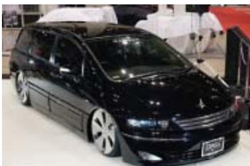
ギャルソン オデッセイ